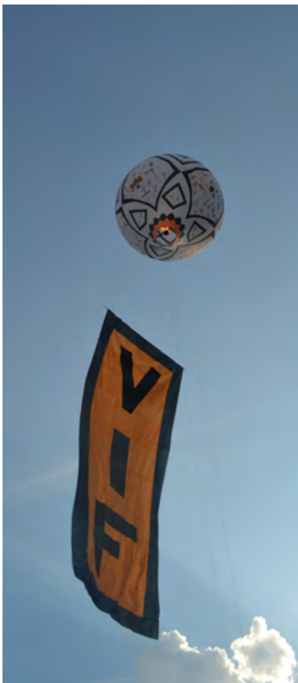
Fête Nationale du 13 Juillet

Ateliers et spectacles gratuits. Billets à retirer à la Bibliothèque ou à la Librairie L'Esprit Vif Mairie de Vif : Renseignements Service Culturel 04 76 73 50 87