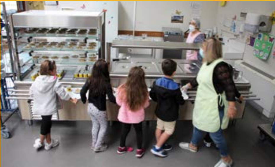
— Au Genevrey, comme dans les autres groupes scolaires, l'installation d'un self a ravi les élèves d'élémentaire —

alternés pour limiter les brassages entre les différents groupes. À titre d'exemple, le temps du périscolaire des élèves de Reymure a lieu directement dans leur école et non plus à Champollion.