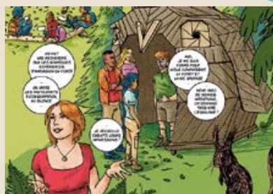
Illustration : Ben Bert