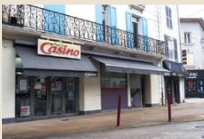
Le Petit Casino